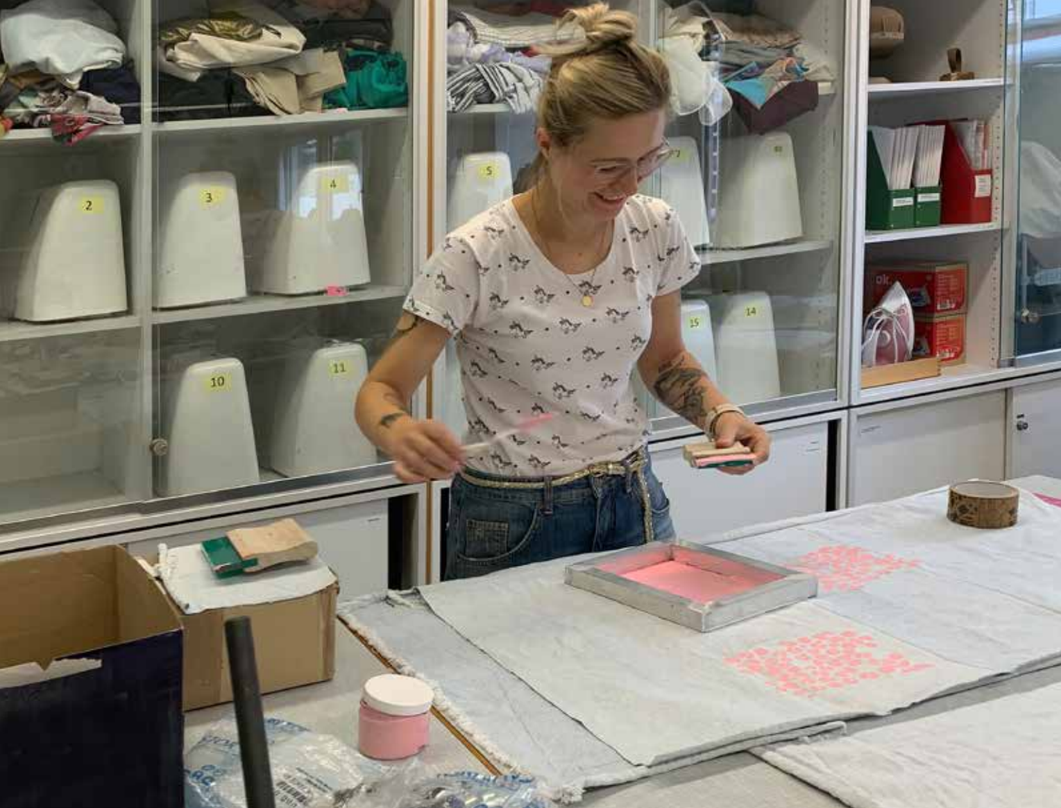
Studierende Anja Leshoff.