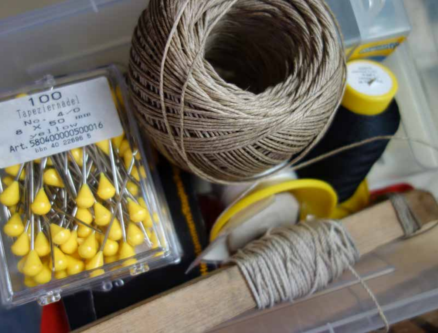
Arbeitsmaterial im Seminar Sitzwerk.