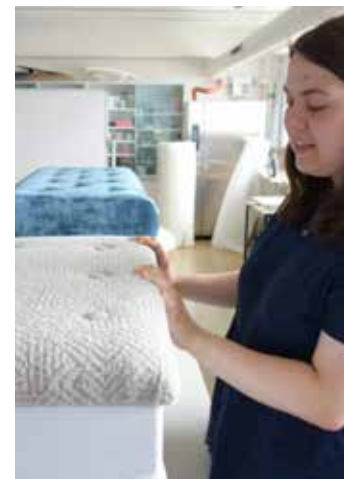
Studierende und Lehrende im Seminar Sitzwerk.