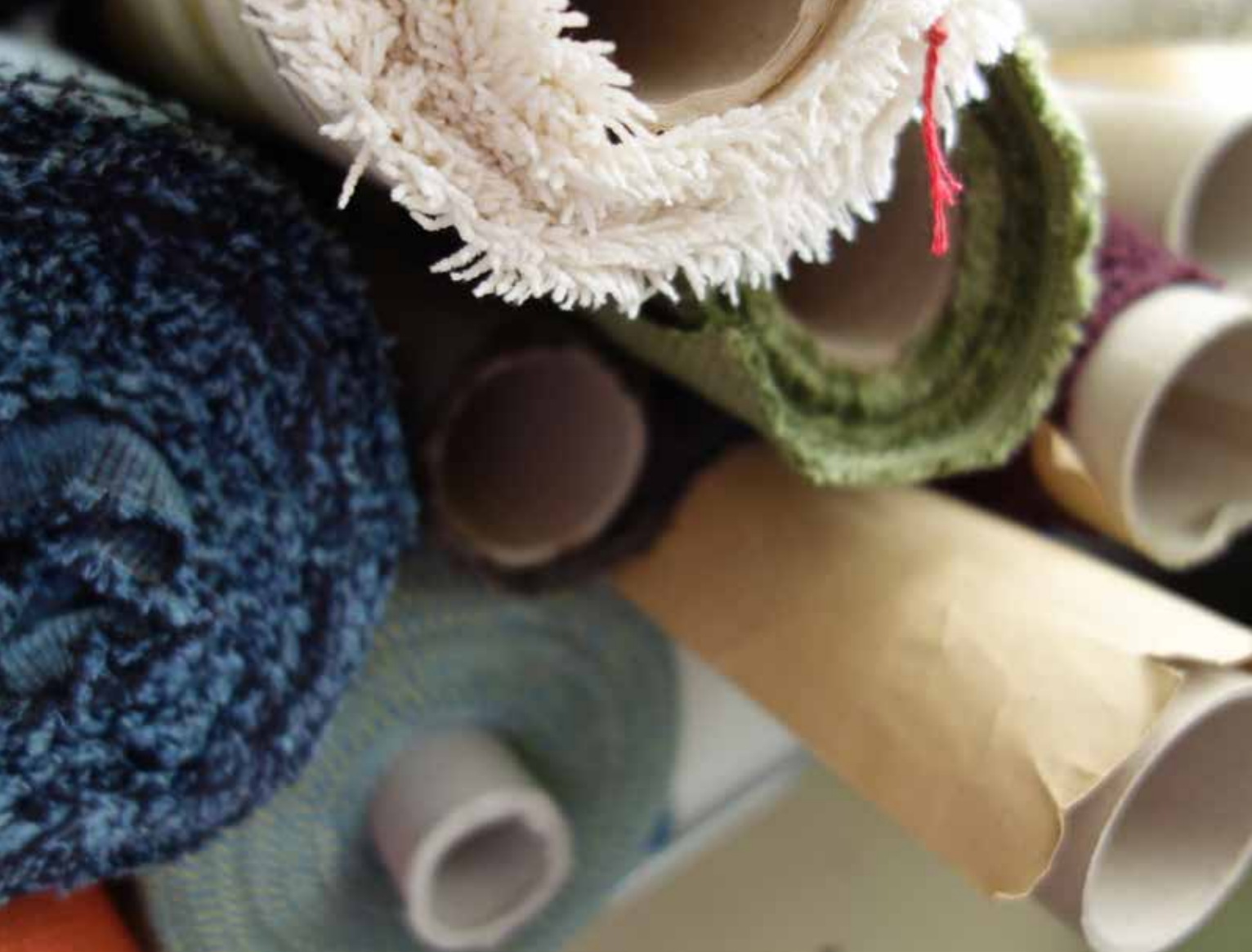
Polsterstoffe des Kooperationspartners JAB ANSTOETZ für das Seminar Sitzwerk.