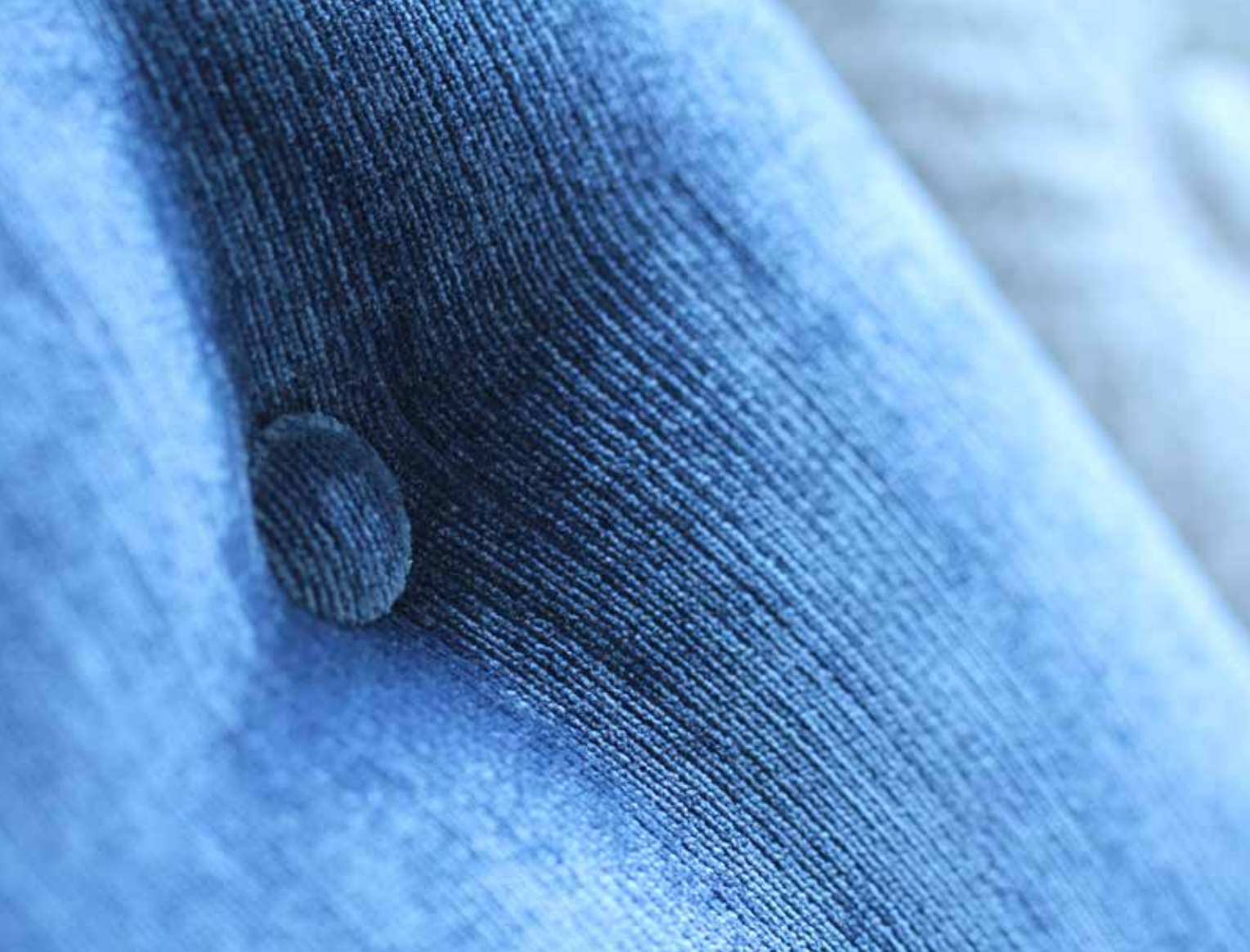
Handbezogener Knopf im Seminar Sitzwerk.